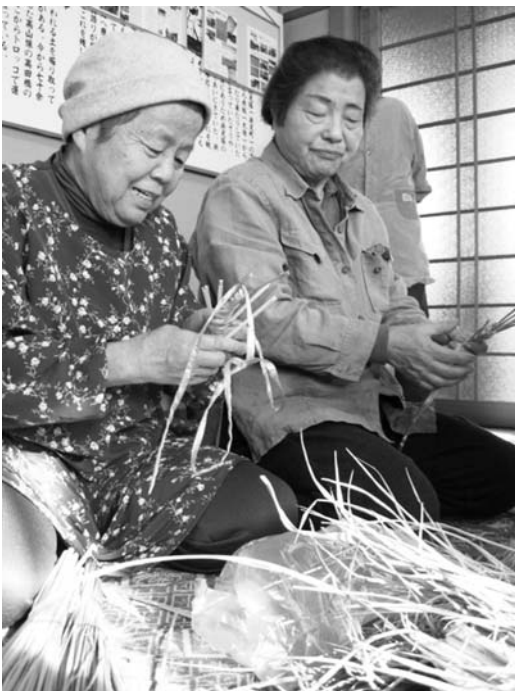
ボランティアハウス事業にも社協会費が使われています。写真は「ボランティアハウス浜友会」恒例になったしめ飾りづくりの様子です。