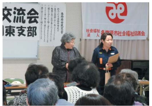
見事な演技に、皆さんひきこまれていました

平成22年12月12日、稲羽東福祉センターにて『歳末たすけあい交流会』が開かれました。約80名の参加者は、各務原警察署の方から振込め詐欺に遭わないためのお話をききました。また、劇団「つくしんぼ」による『悪質商法よさらば』と題した寸劇で、消費者被害の防止を学びました。寸劇ではおばあさんと詐欺師とのやりとりが、いかにもありがちな会話の掛け合いで、ときおり笑い声も聞かれ、楽しみながら学ぶことができました。