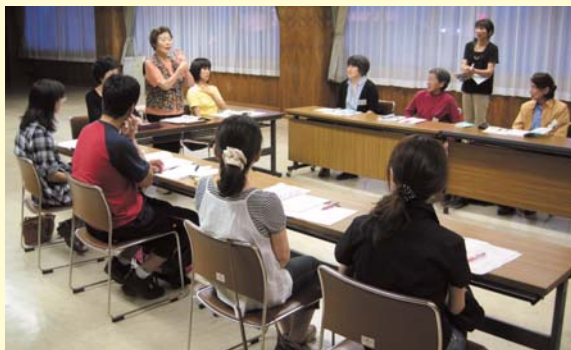
今年の講座の様子。 「私の名前は…」と自己紹介しています。