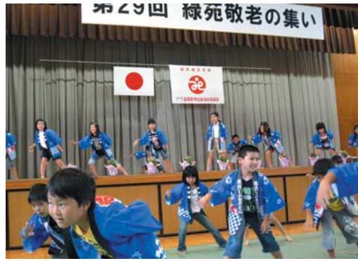
迫力のあるソーラン踊り

平成22年9月23日、緑陽中学校体育館にて敬老のつどいが開催され、191名が参加されました。緑苑団地内の坂道も支部役員さんの心づかいにより貸切バスの送迎がありました。バスにより安心・安全に参加でき、いつもより多くの方でにぎわいました。余興では、地域サークルの