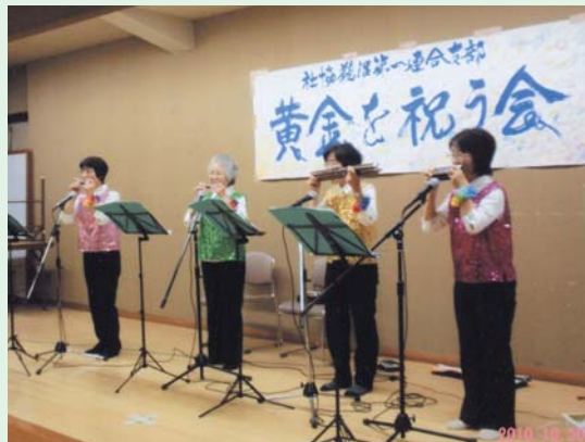
社協鶴沼第一連合支部「黄金を祝う会」にてすてきな音色を披露