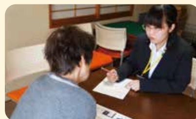
さぼーとの出張相談