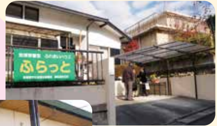
ふらっと(緑苑地区)