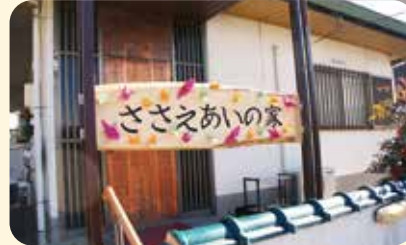
ささえあいの家 (八木山地区)