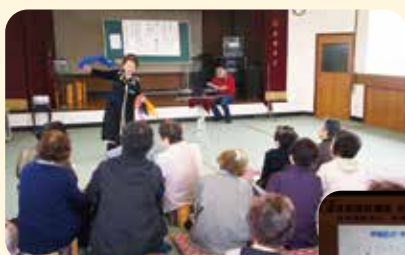
ボランティアハウス (小伊木いきいきサロン)