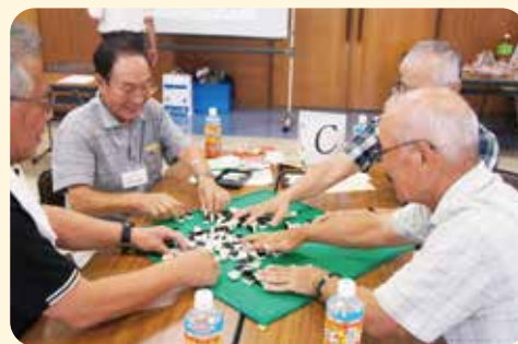
地区社協の活動(陵南地区)