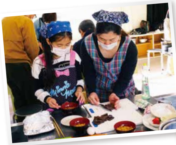
料理で交流事業 みんなでチミ(ヘリ)(稲羽西地区)