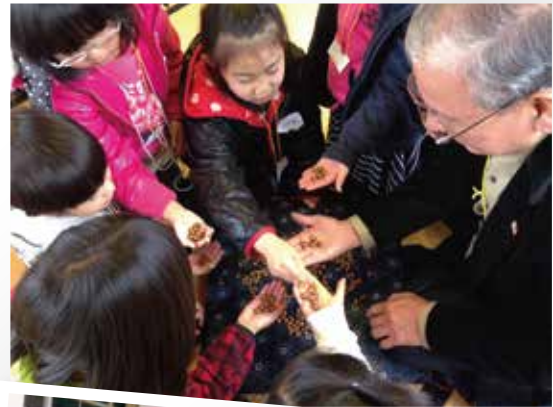
世代を超えて楽しんだ どんぐり数当てゲーム(川島地区)

各務原市では昭和57年から17支部社協が誕生し、住民を主体とする小地域福祉活動に取り組む重要な役割を果たしてきました。ボランティアハウスを立ち上げたり近隣ケアグループ・民生委員児童委員による友愛訪問など、支部社協は住民にとって身近な存在であり、これまでも地域の特性を生かしたさまざまな地域福祉活動が展開されてきました。