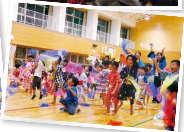
夏祭りでシャクリングを体験(稲羽東地区)

そしてこの4月の社会保障制度改革による各法律改正では、地域での自主活動に対する期待は高まっています。