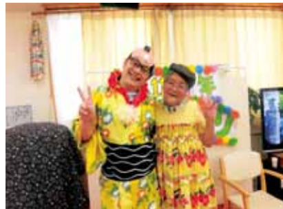
男性部門 ニッケ・ケアサービス