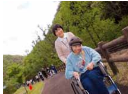
女性部門 さわらび苑