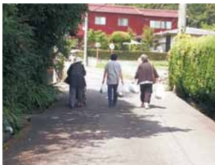
荷物を持ち合い、自宅に帰ります。

参加者のうち買い物を希望したのは誰かの手を借りないと買い物に行くことが難しい四人の高齢者。車内では、ちょっとした旅行気分となり、短い時間ですが、昔の話題で大盛り上がり。 近くのスーパーマーケットに到着すれば、バリアフリーになっているので、一人で買い物ができます。「車で来ているので、牛乳も一とサイズが買えるわ」と笑顔が見られました。