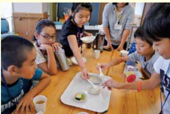
刻み食を食べてみました

最初は緊張しつつも徐々に利用者の方に声をかける子どもたちが大勢いました。困っている方に手を差し伸べることで、少しでも生活の手助けになることを学べたようです。 将来を担う子どもたちが、この体験を活かして各務原市で活躍することを願っています。