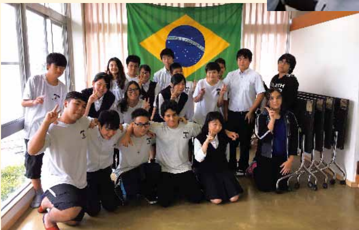
ブラジル人学校の生徒と