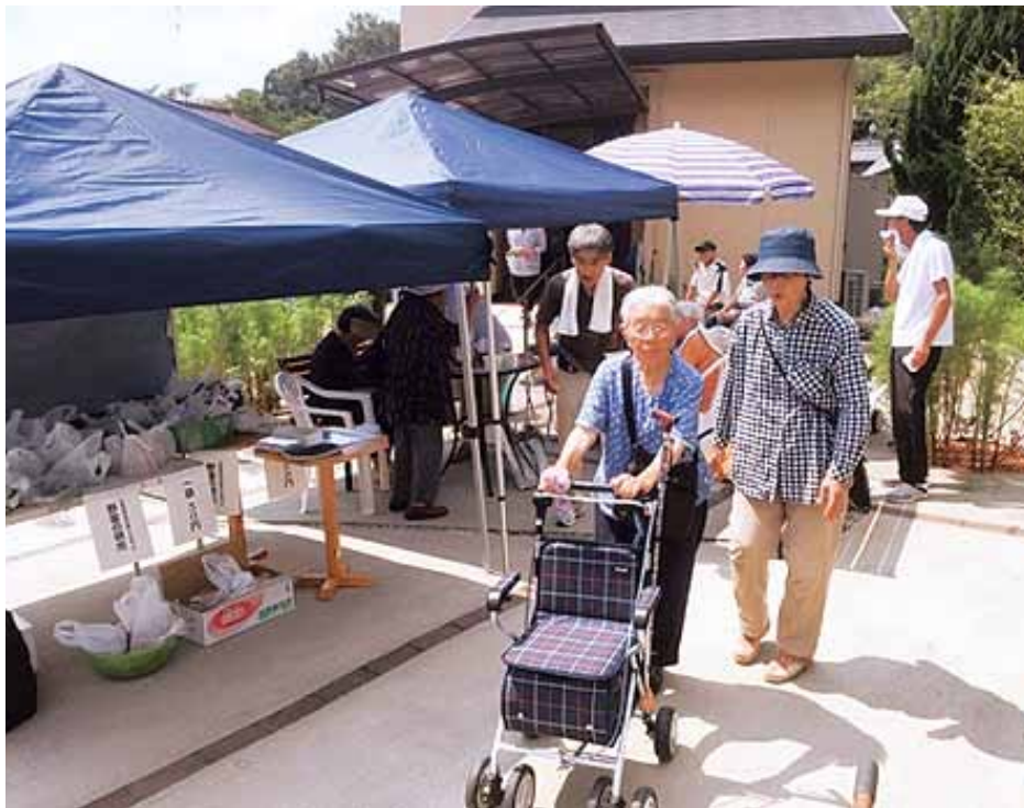
お出かけサロンの初日、家庭菜園の野菜も並び、近所の人も集まりました。

市内の北部に位置する川崎団地。スーパーマーケットから遠く、生活に不便を感じる住民がいることを課題と感じた自治会は、『何か自分たちでできることはないか?』とふれあいタクシーの乗車体験会を開催するなど、この地で生活していく方法を考えてきました。この度、新たな支えあいにより買い物の不便さを解消する取り組みを始めました。