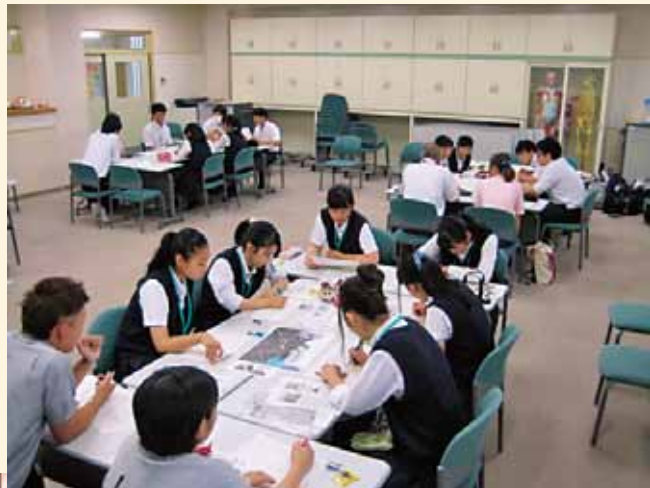
高校生と大学生のグループワーク

高校生からは「障がい者や外国人に対し理解が深まった。」とイメージを変えることができたようです。今後、この経験を活かして若い生徒・学生たちが自分たちにできることを考え「魅力ある地域」を目指して活動を続けていく予定です。