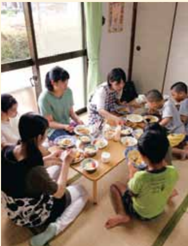
子ども食堂での交流

この夏には、「かかみがはら車いすテニスサークル」との交流や食事を通しての居場所づくり団体『みんなのおうちーおだやか荘ー』、鵜沼山崎町にあるブラジル人学校『ノヴァ・エタッパ』へ訪問しました。実際に、障害のある方と交流を行ったり、子どもが食事を通してありのままでいられる居場所をつくる団体や、市内にある外国人学校などと関わりを持つことで、地域福祉に理解を深めることができました。