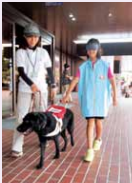
盲導犬体験コーナー

今年の福祉フェスティバルは天候に恵まれ、各参加団体から福祉活動の魅力幅広く市民に発信しました。特設ステージでは、ダンス・太鼓・バンドによる発表で会場が盛り上がり、各ブースではさまざまなゲームや展示を楽しむ来場者の姿が見られました。