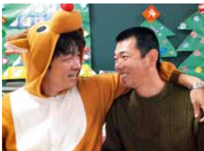
男性部門 さわらび苑