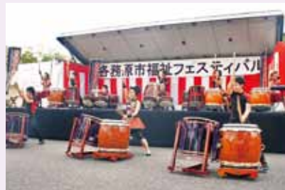
各務原太鼓保存会による発表

今年の福祉フェスティバルは天候に恵まれ、各参加団体から福祉活動の魅力幅広く市民に発信しました。特設ステージでは、ダンス・太鼓・バンドによる発表で会場が盛り上がり、各ブースではさまざまなゲームや展示を楽しむ来場者の姿が見られました。