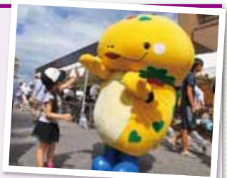
県社協キャラクター「ともにん」