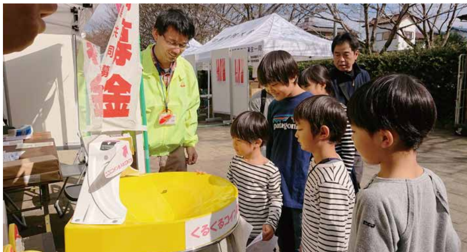
■ 昨年の学びの森フェスティバルでの街頭募金 コインがくるくる回る不思議な募金箱

詳細問合せ 岐阜県共同募金会各務原市支会(各務原市社会福祉協議会) ☎(0566)333-7610