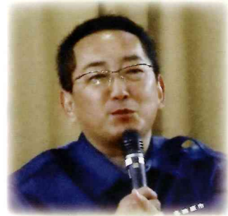
浅野市長開会あいさつ