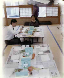
塚原市議 絵手紙にチャレンジ