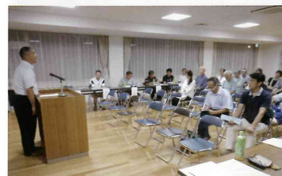
松原教頭先生のあいさつ