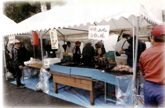
山崎区の模擬店 (お好み焼き) この後、長蛇の列となりました