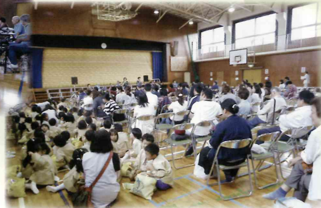
ブルーベレーズの演奏 なつかしい歌が多かったです