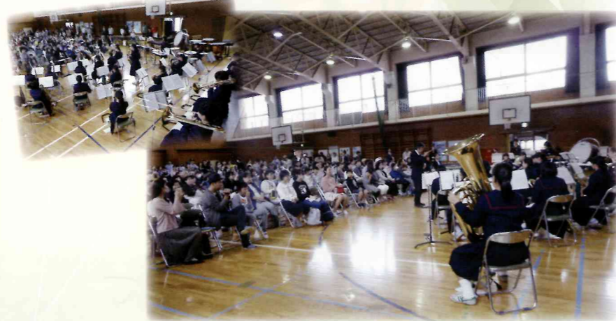
緑陽中学校吹奏楽部の演奏 アンコールもありました