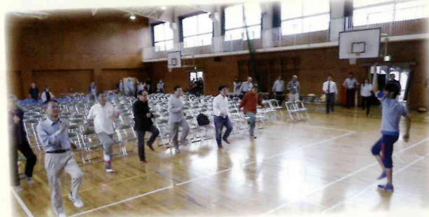
開会後のエアロビ