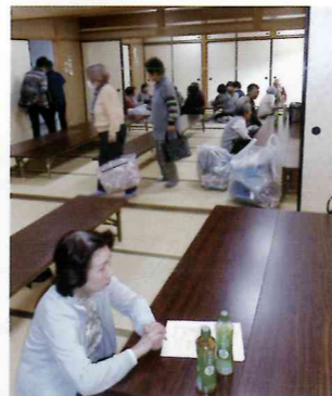
2階の和室が昼食場所