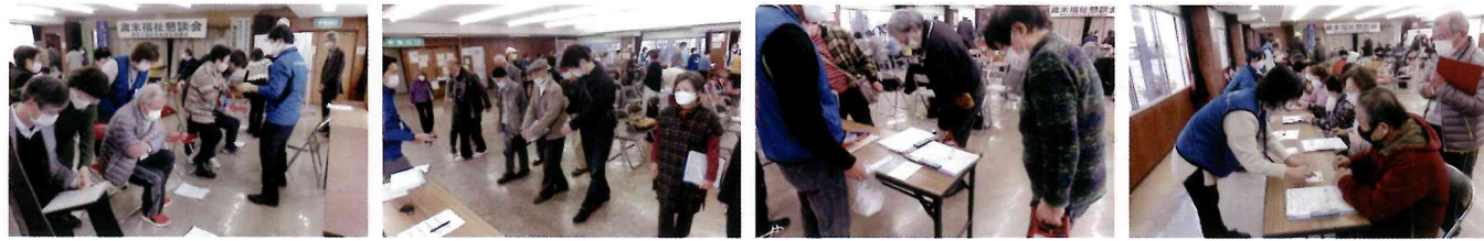
座位からの片足立ち上がり