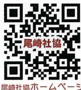
尾崎社協ホームページ

「尾崎社協」でネット検索すると、尾崎社協ホームページとFacebookが最上部に表示されます。