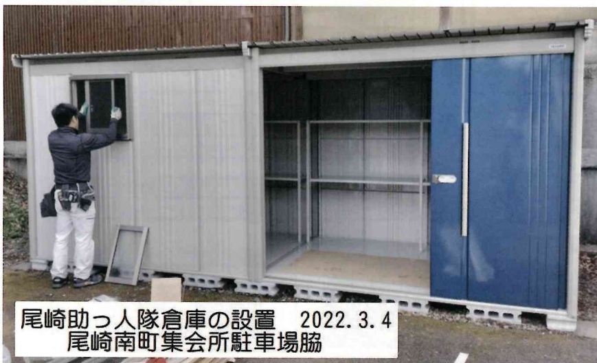
尾崎助っ人隊倉庫の設置 2022. 3. 4 尾崎南町集会所駐車場脇

何しろ初めて取り組む事業です。不慣れで様々な行き違いや失敗が生まれ、スムーズに活動が出来ないかもしれません。皆様のご理解をいただき、円滑に事業が行えるように努めていきます。