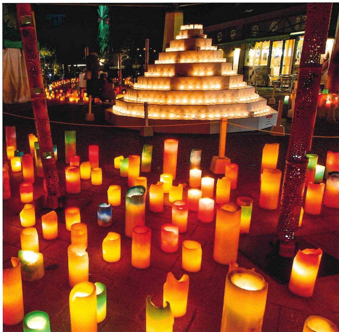
「河川環境楽園」(各務原市)