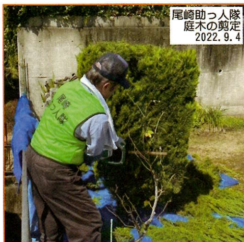
尾崎助っ人隊 庭木の剪定 2022. 9. 4