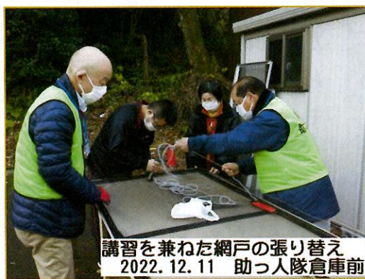
講習を兼ねた網戸の張り替え 2022. 12. 11 助っ人隊倉庫前

今後の課題は、助っ人隊をもっと利用し易くする方法を考えること、支援依頼の受付を充実すること、隊員を手配するコーディネーターを増員することなどです。