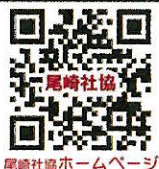
尾崎社協ホームページ