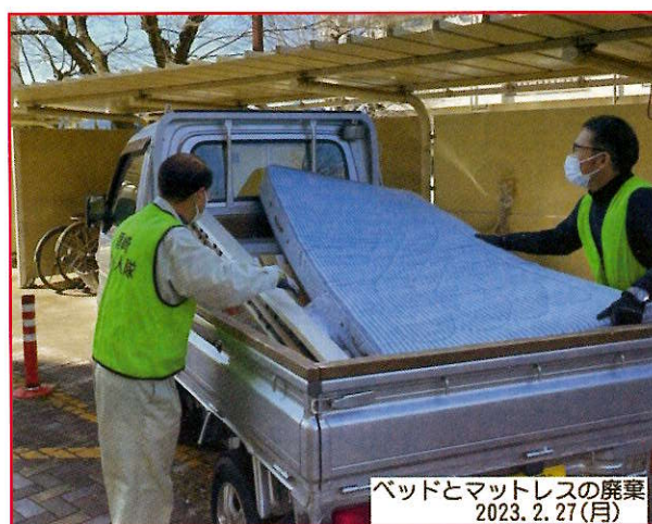
ベッドとマットレスの廃棄 2023. 2. 27(月)