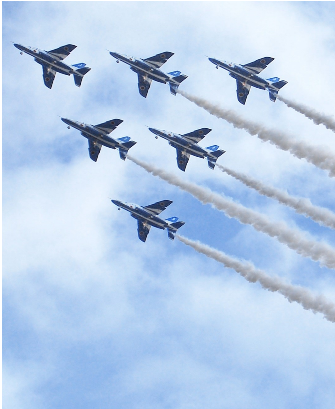
「岐阜基地航空祭」(各務原市)