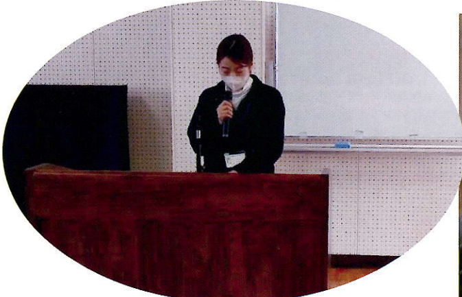
▲市社協から福祉の現状について説明