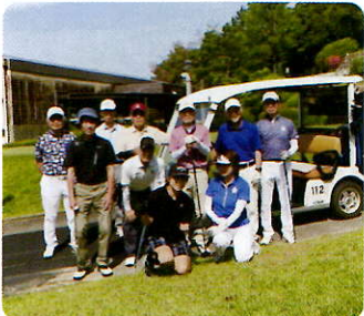
▲ゴルフサークル『つきいち会』