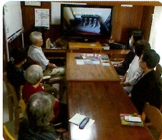
▲音楽鑑賞『そなんららレーブ』