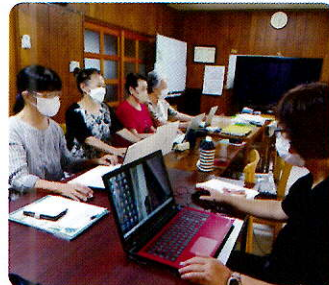
▲パソコン・スマホ『そなんららレーブ』