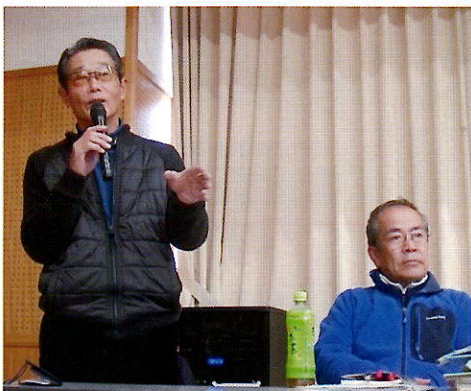
▲会長より今後の作物の分配やおすそわけについて