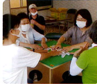
▲健康麻雀『すずめの学校』