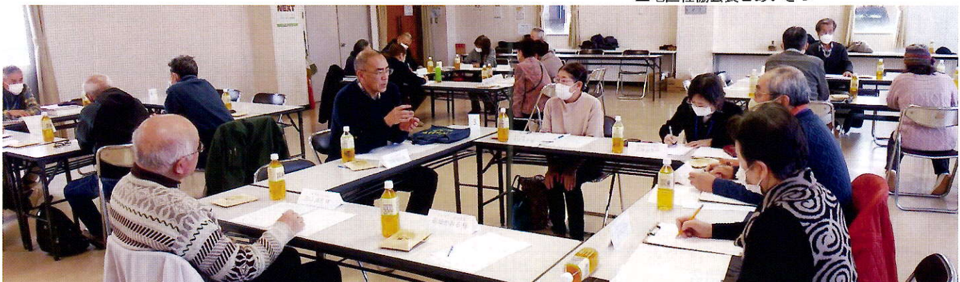
▲自治会長、近隣ケアグループ代表、シニアクラブ代表、民生児童委員がそれぞれの立場から思い思いの意見を出します