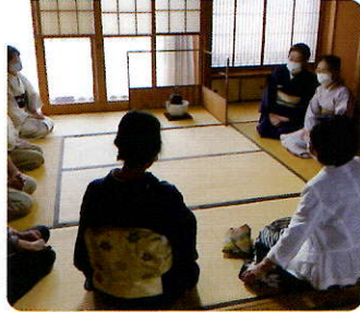
▲『茶の湯サロン蘇二』