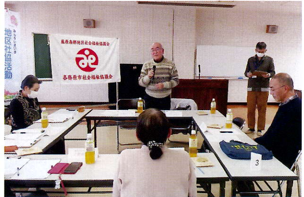
▲自治会長より地域の状況を報告

2月3日(土)蘇原福祉センターにて、六軒地区を対象とした小地域福祉ネットワーク座談会を開催しました。民生委員が担当する地域を軸として、その地域の福祉に関わる主要な方々である自治会長、近隣ケアグループ、シニアクラブ、そして民生委員の皆様をつなぐ仕組みとして「小地域福祉ネットワーク」と名付けました。各々の地域の福祉にご尽力される皆様に、個人の力では解決できないことや、ネットワークの協力があれば解決の糸口が見えると思えることを話し合いました。