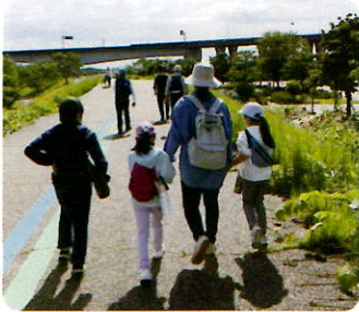
▲ウォーキングサークル『歩こう会』