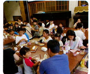
▲子ども食堂『ふれあい食堂』