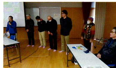
▲今年度の農園の役員紹介