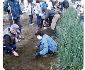
▲グループ農園『井戸端農園』