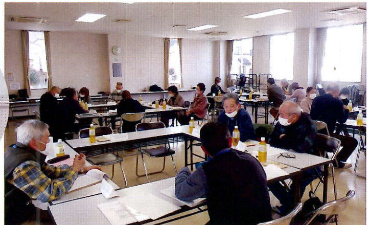
▲忌憚のない意見を出し合います