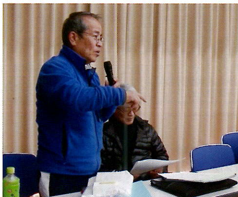
▲園長より水やりや作業の当番制について