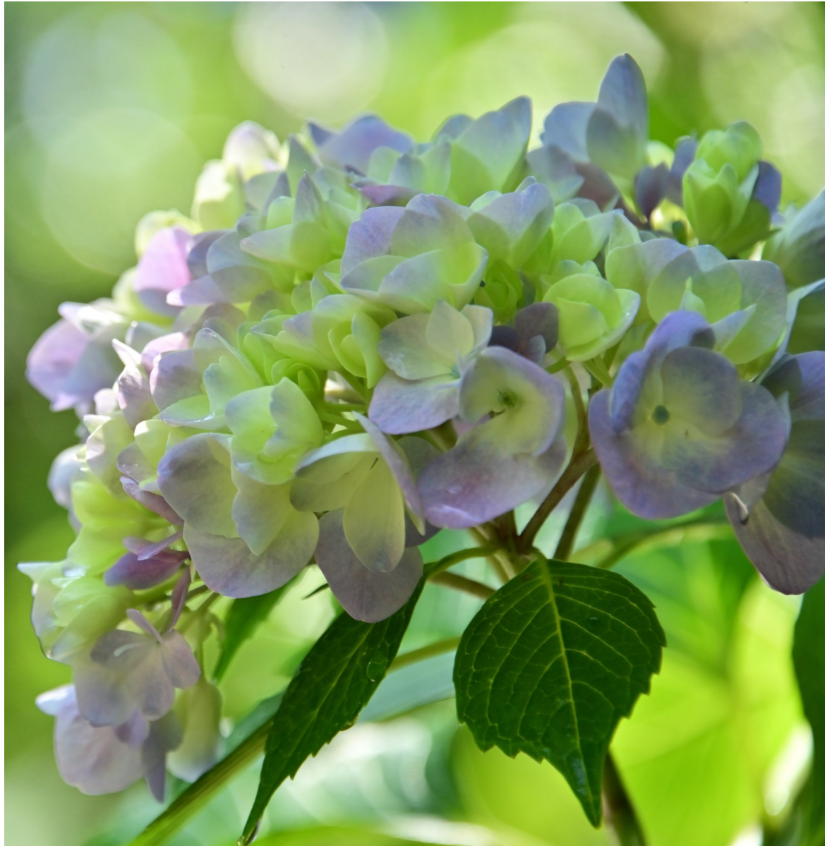
美濃加茂市「みのかも健康の森」あじさい