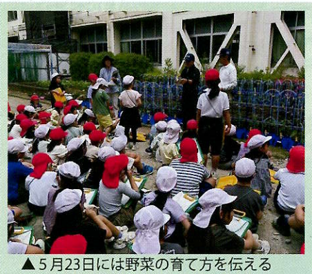
▲5月23日には野菜の育て方を伝えるために再度学校へ行ってきました。