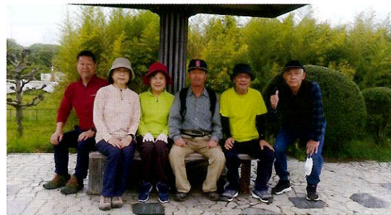
▲ところどころにベンチが設置されています

きれいに整備され、景観・利便性も良くなり、今年3月に完成したJR蘇原駅前広場に集合して、JR高山線で美濃太田駅に移動した後、木曾川右岸堤防ロマンチック街道を坂祝駅までゆったりと約6kmのウォーキングコースを楽しむことができました。 <ロマンチック街道> 日本ラインロマンチック街道とは坂祝町を流れる木曾川の堤防に沿って整備されたサイクリングやジョギング、散歩を楽しめる全長4kmほどの道路です。