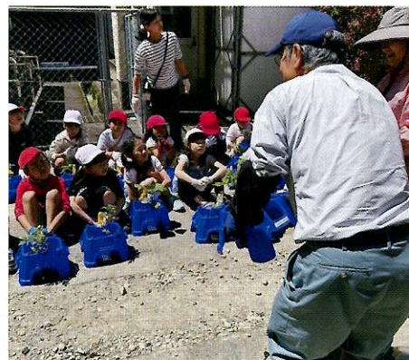
▲苗の植え方の説明を聞く児童たち