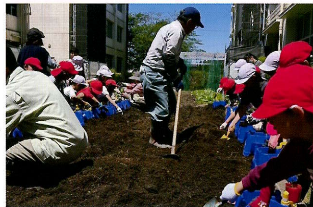
▲土を自分の鉢に入れていきます

5月9日に蘇原第二小学校から依頼を受けて、2年生の夏野菜を育てる授業に作業指導を兼ねて参加してきました。3学級約90名の児童たちはそれぞれトマト、ナス、ピーマンの中から自分の好きな苗を選択し、私たちが指導する植え付け方法を真剣な眼差しで学んでいました。そしていざ実践、学校の中庭にある畑土を自分のプランターに入れ、苗のポットを外し植え付け、そして土を被せてたっぷりの水を与えていました。今後は育て方を学びながら、いかにお世話ができるかが課題です。立派に収穫でき、楽しんでくれる姿を想像し見守っていきたいと思います。