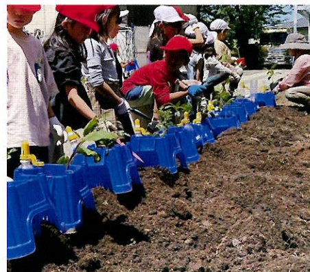
▲ナスやトマトの苗をそれぞれ植えました