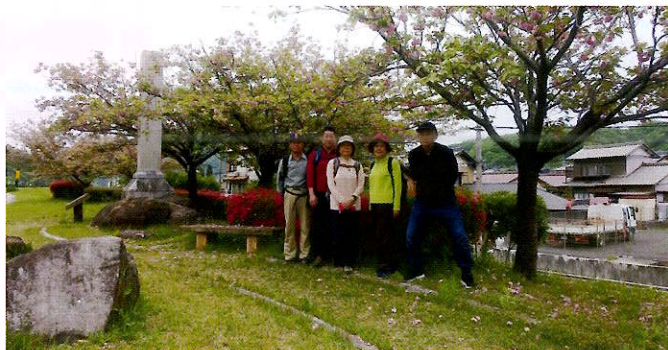
▲八重桜も終盤ですがまだきれいに咲いていました