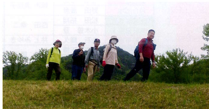
▲日本ラインと呼ばれた木曾川を眺めながら歩きます