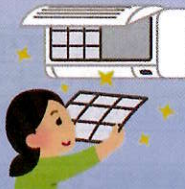
エアコンフィルター掃除