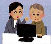
パソコン・スマホの操作