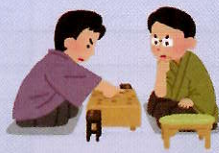
囲碁・将棋のお相手