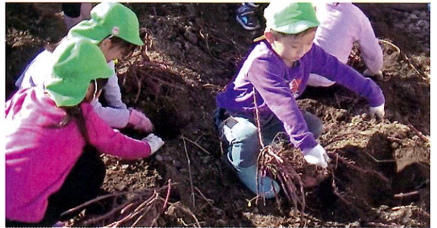
▲ツルを力いっぱい引っ張ると芋がついてきます

また、午後からは蘇二小のいずみ活動の一部門として、児童が取り組んでいる農園クラブもさつまいもの収穫をしました。自分達が苗を植えたさつまいもの成長に驚きと共に、収穫したさつまいもを見て、たいへん満足し農園クラブの良さを実感していたようでした。