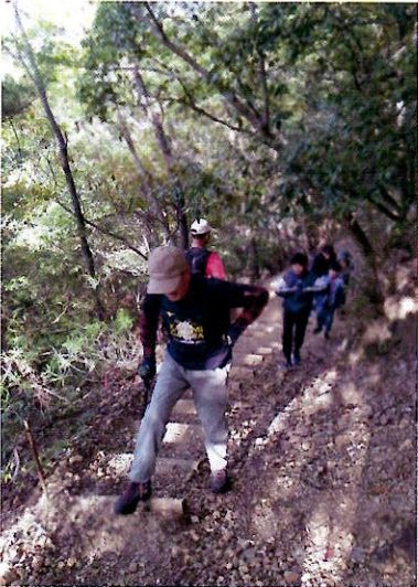
▲登山道ではすれ違う人とあいさつをします