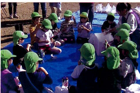
▲みんなで焼きたてのお芋をいただきます