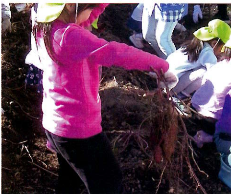
▲大きいのが採れたよ！