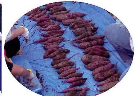
▲大きいのも小さいのもたくさん