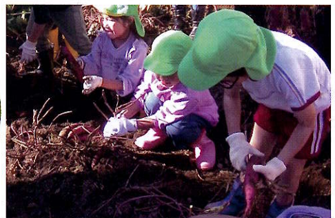
▲どんどん芋が出てきます