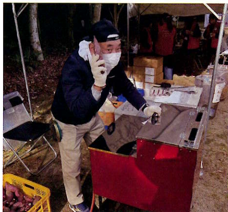
▲下山後には焼き芋がふるまわれます