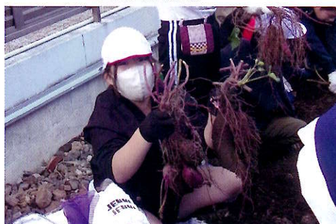
▲いっぱい採れたよー！