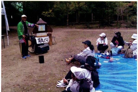
▲今回初めて紙芝居を楽しんでもらいました