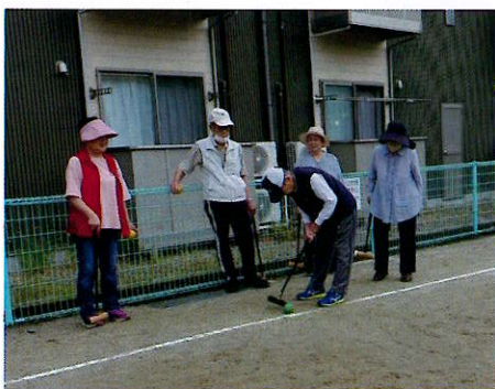
▲狙いを定めて慎重なショットも