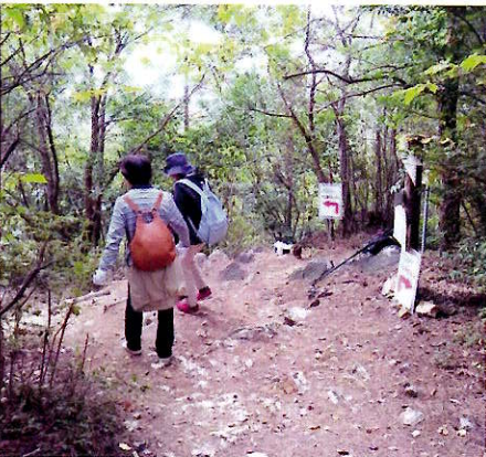
▲今回案内看板を大きくして貼りました