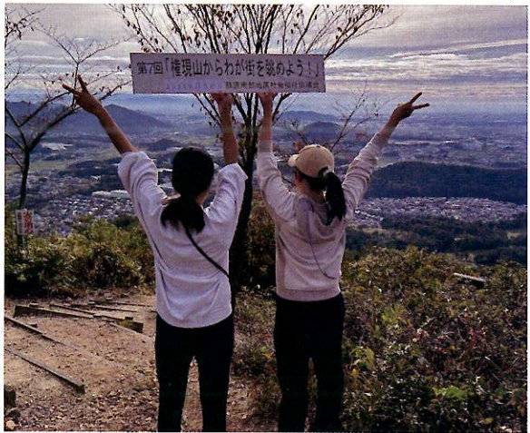
▲天気も良く頂上は最高の眺望でした

11月10日(日)晴天秋空に恵まれ“第7回権現山からわが街を眺めよう”に大人38名、子供20名が参加し実施しました。登山、山頂近くになると、北は白山、御嶽山、南は名古屋ビル群も見える濃尾平野の絶景とともに、登山しながら遊べる「各務原市豆知識クイズ」で故郷への思いを深めて頂きました。なお、ほとんどの方が苦戦のようでした。下山後のイベントとして、紙芝居、ビンゴゲームをし、焼きたての甘い焼き芋を食べながら楽しみました。