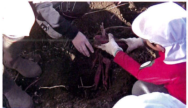
▲土の中からまだ大きな芋が出てきます