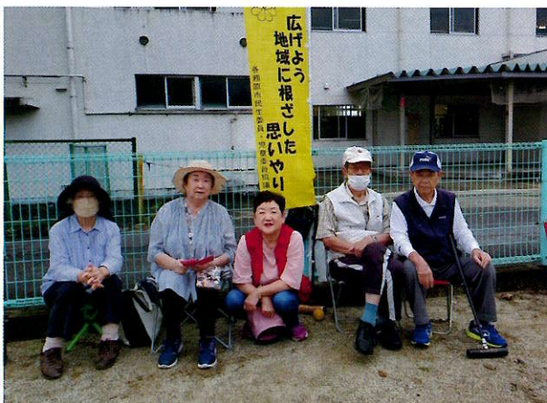
▲月丘団地寿会チームのみなさん