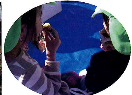
▲焼き芋はとっても美味しいね