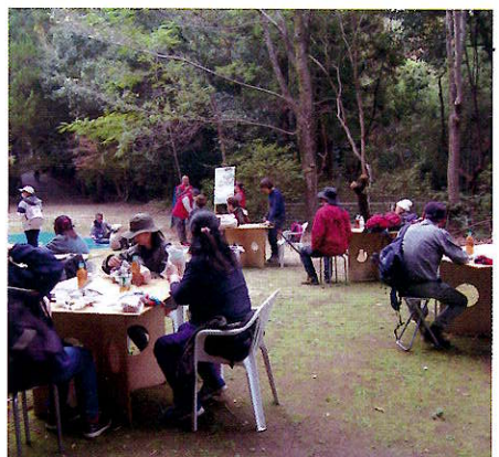
▲ビンゴゲームを楽しむようす