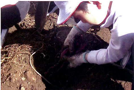
▲途中で折れないように丁寧に掘ります