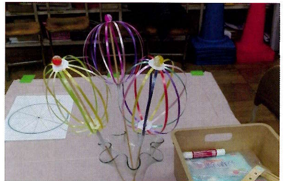
▲お花のくるくるスティック完成品

帰り際には「ありがとう!」とお礼の言葉も明るく、みんな満面の笑顔で帰って行きました。