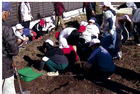
▲小学生も次々に芋を掘り出します