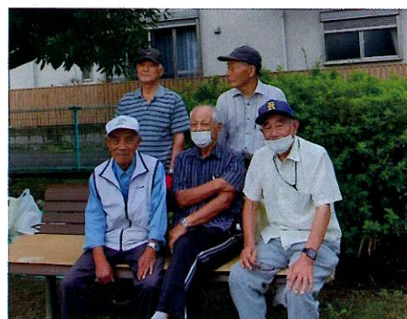
▲六軒北新和会チームのみなさん