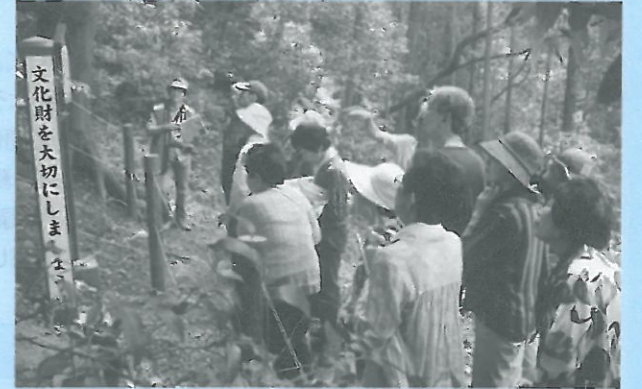
(ガイドに聞き入る参加者)

参加者は56名で、中型観光バス2台は満員でした。関ヶ原にある不破関資料館では、ボランティアガイドさんから壬申の乱にまつわる説明を受けながら、周辺に点在する遺跡をゆっくり歩いて見学しました。