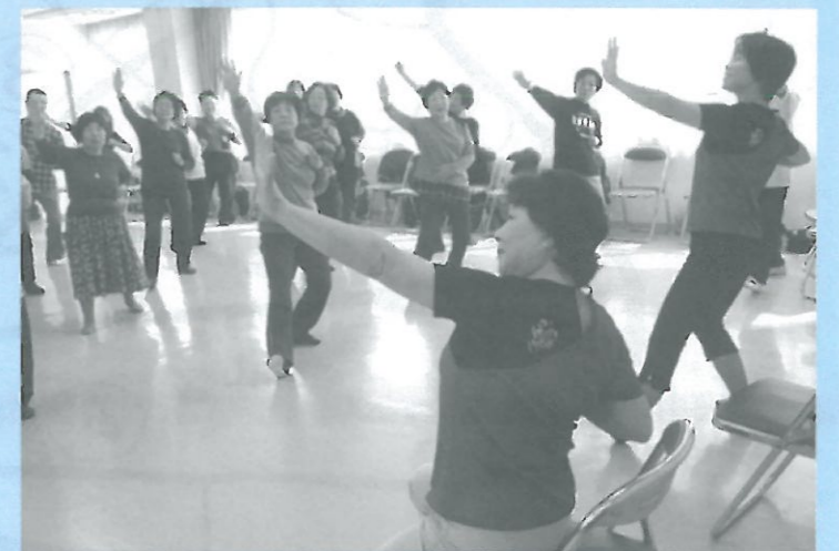
(立位と座位で講習)