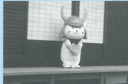
(ひこにゃんのパフォーマンス)

天候に恵まれ、また参加者同士の交流もあって、それぞれが思い出深い1日になったようでした。