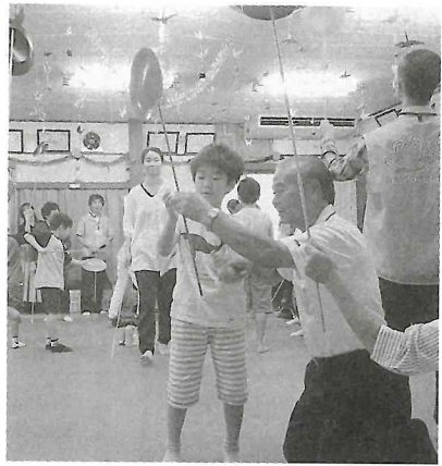
昨年の地域ふれあい広場

コロナ感染はこの先もまだまだ予断を許さない中、「新たな生活様式」の実践が叫ばれています。外出時にはマスク着用、人との間隔を2メートル以上空ける、食事は対面ではなく横並びで等々です。これら物理的な距離が、心理的距離まで広げてしまいませぬように。