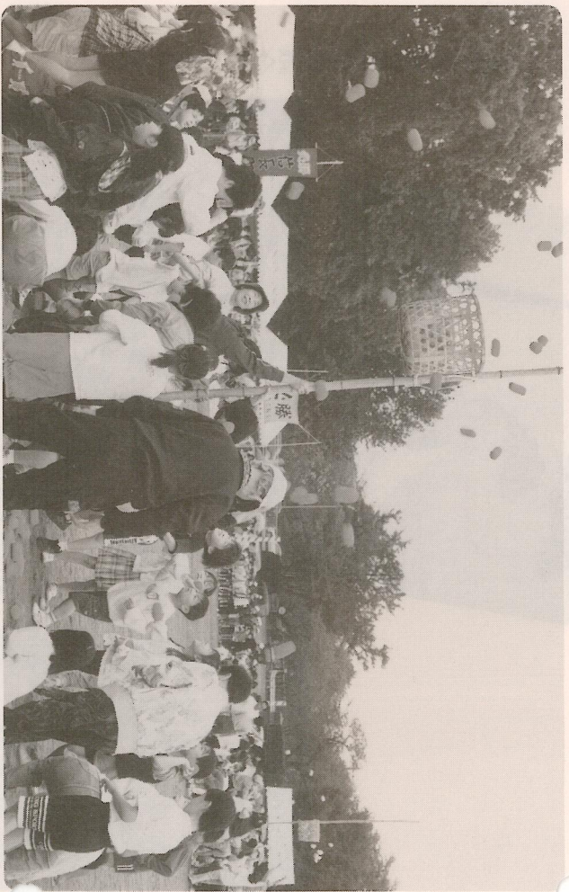
▲小雨も何のその。狙い定めてソレ!!—玉入れ