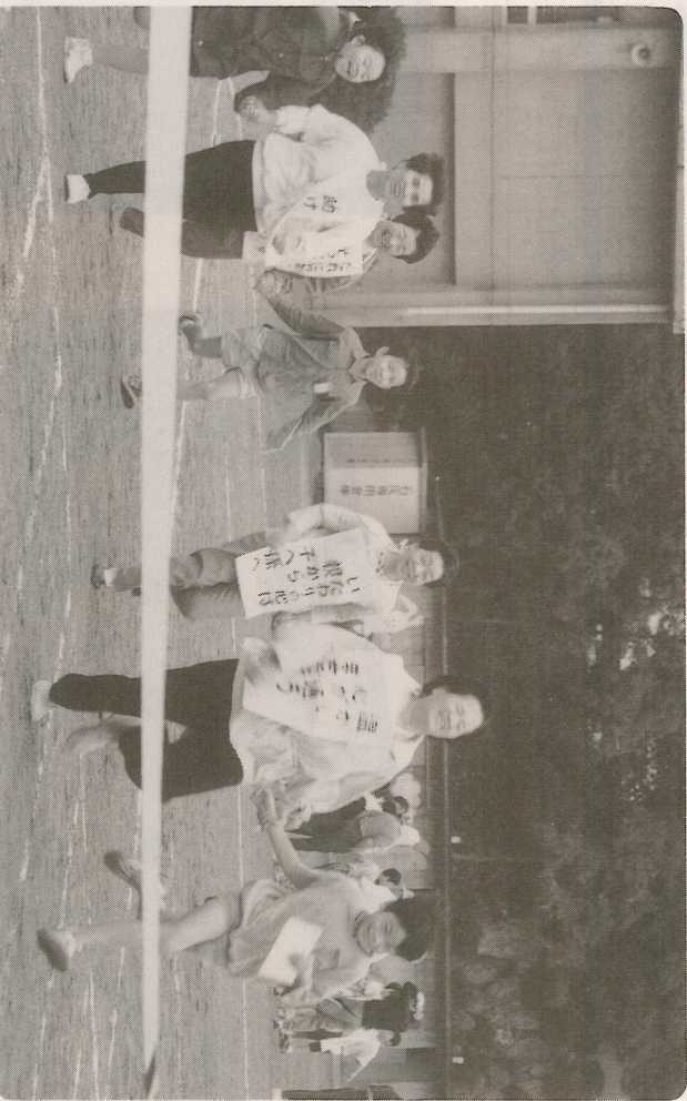
▲借り物競争—元気なお孫さんに引っぱられ走る！