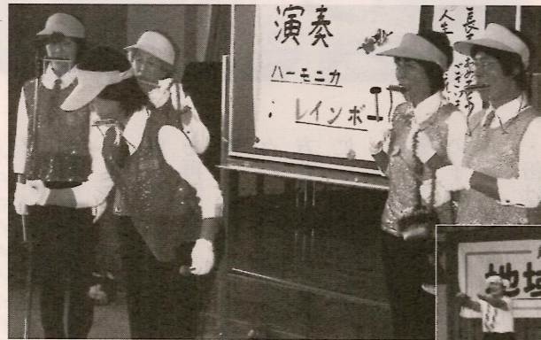
ボランティアによるハーモニカ演奏や フラダンスなど披露

には美味しくななお弁 あいが皆さんに配られ、わきあいあいと楽しそうに口に運んでおられました。食後のお楽しみ会が始まると、元気な出演者がフラダンスショーを披露したり、役所の方によるオレオレ詐欺の防