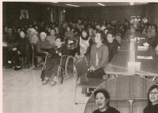
悪徳商法の寸劇を交えた 市民相談課の講話

第23号 平成17年3月31日発行 編集・発行 各務原市社会福祉協議会 那加二東部支部