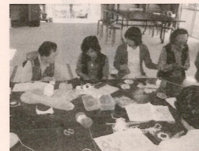
③毛糸でタワシ作り 「この所はきゅつと引くときれいに丸くなるよ。」