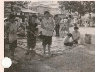
①夏祭 「近所のおじさんに教えてもらった水鉄砲だよ！」 「よく飛ぶよ！」

ゲームなどをしたり、新緑の空気にいっばい吸って世間話にも花が咲きとても和やかに楽しく、撮っていただいた記念写真を見ながら何時までも心に残る思い出の日となりました。これに近隣ケアの方や自治会長さんのお陰と何時も感謝の気持ちで一杯です。