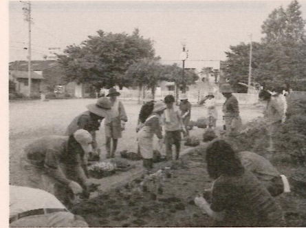
踊り、手芸、血圧測定等バラエティーに富む一時を楽しみます。又、月四回朝七時から九時までの体力向上のため、グラウンド

私たちの活動モットーは、何事も手作りとし、自治会長、シニアクラブ、民生児童委員と私達とで、さつき会を結成し年六回恒例行事として誕生会を開いています。皆さんの一番の楽しみは昼食です。四季折々のメニューで竹の子ごはん、おはぎ、ちらし鮭、松茸ごはん、とん汁等皆さんに大変喜んでもらっています。又前日の夜に準備をします。が、近隣ケアも先輩方のアドバイスを参考にし、皆さんの協力で楽しく作っています。食事の後皆さんとゲ