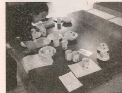
②陶器に絵付 「皆それぞれのいのができた。私にも名前を書いてください。」