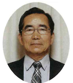
那加二東部地区 社会福祉協議会会長