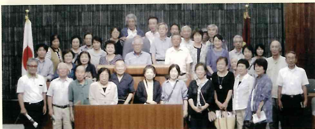
議会場にて記念撮影

各務原市のバスで、市内の施設を見学しました。北清掃センター、消防本部、議会事務局を訪問し、施設の実態を学びました。