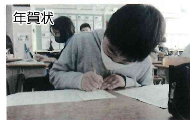
113名の高齢者へ（6年生）