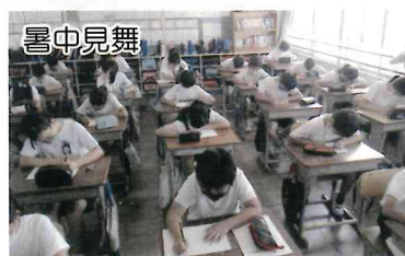
107名の高齢者へ（5年生）

コロナ禍の自粛生活で人の交流が困難な1年でしたが、郵便ハガキなら大丈夫!! 那加第三小学校の5年生(83名)と6年生(62名)が、今年度もおひとり暮らしの高齢者に「暑中見舞」と「年賀状」を書いてくれました。総合学習の一環として心を込めて取り組みました。やさしい心をありがとう。