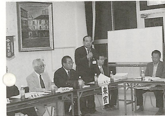
深尾事務局長の挨拶