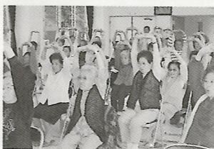
皆で背伸びの運動