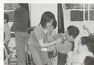
こうして曲げるのヨ