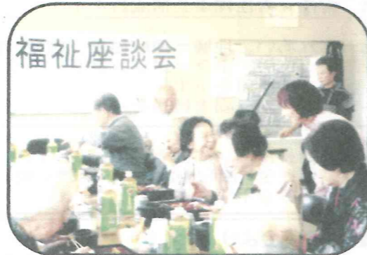
北67 健康についての講話 26.10.27