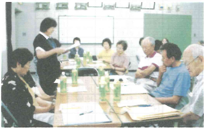
北1 講演とグループ懇談会 26.7.1