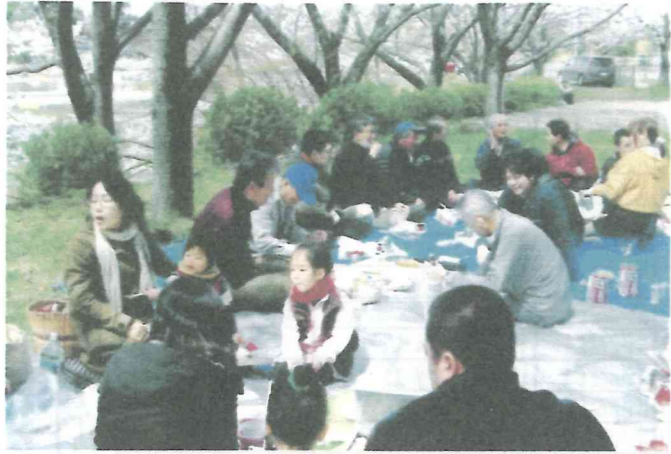
柄山 お花見懇親会 26.4.6