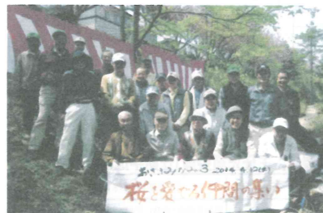
南3 お花見懇親会 26.4.12