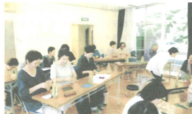
南1 折り鶴づくりと短歌・俳句・川柳学習会 26.6.7

平成26年度の福祉交流会は、南町地区・北町地区の15の自治会で計14回開催され、延べ414人が参加しました。交流会の内容は各自治会の創意工夫で様々な内容でしたが、いずれも各自治会での問題点の情報交換ができました。福祉交流会が福祉への理解と、自治会員相互のつながりを深めるきっかけになったと思われまます。