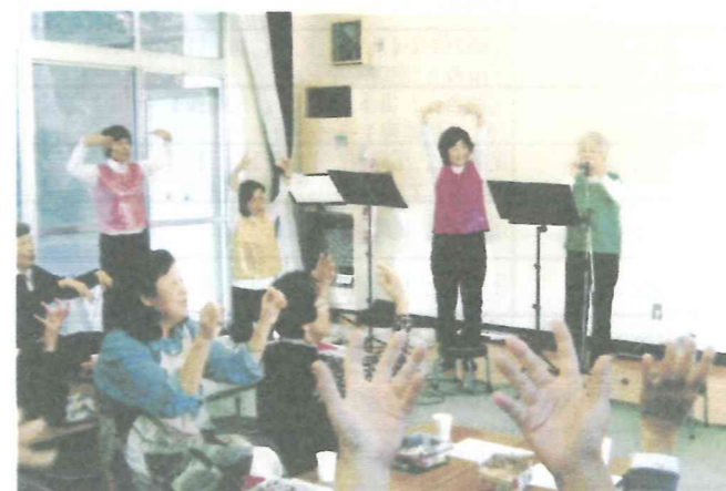
南5 健康的で快適な生活を送ろう 26.11.7