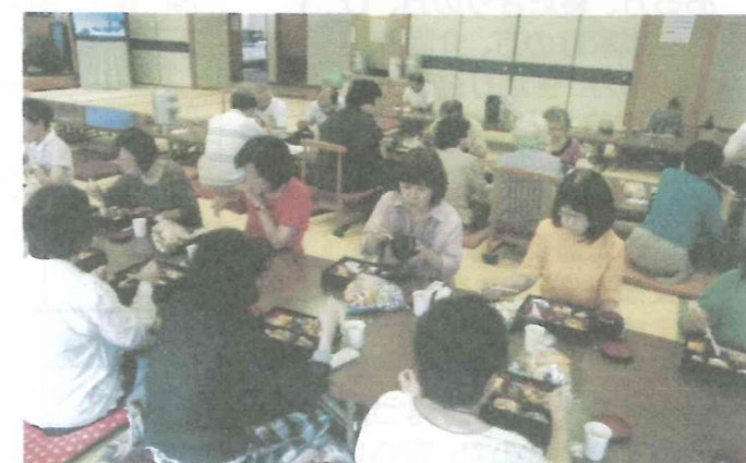
南6 認知症基礎知識の研修 26.9.16