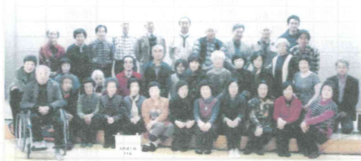
北345 高齢者福祉の講話と軽スポーツ 26.11.29