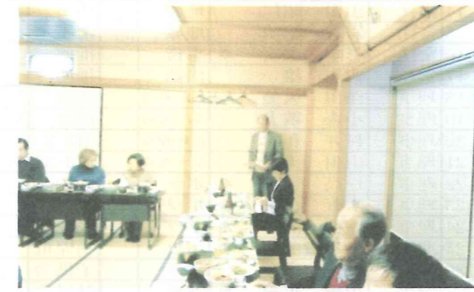
北2 高齢者の介護・認知症等の講話 27.1.31