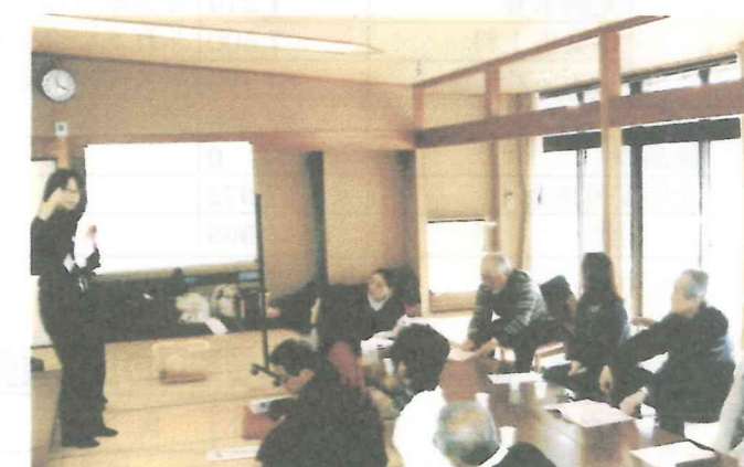
南4 高齢者福祉の講話と意見交換 27.1.17