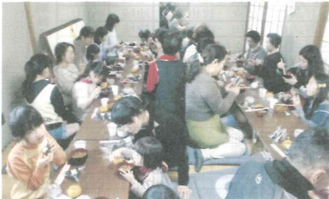
北3 世代間交流と軽スポーツと会食 27.2.15