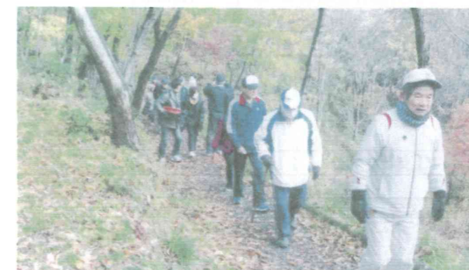
南2 ウォーキングとビンゴ 26.12.7