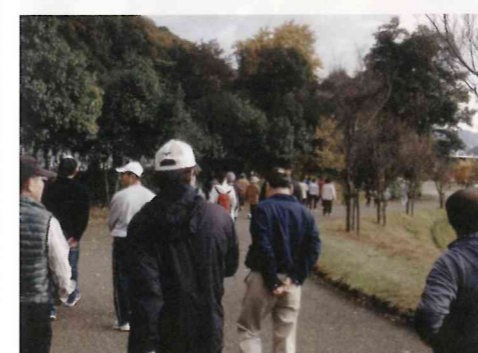
ウォーキング&ビンゴ大会