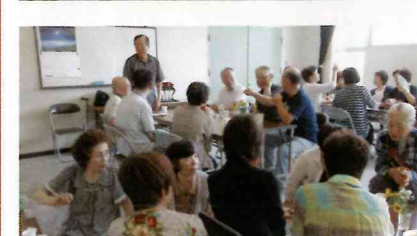
福祉委員、民生児童委員のお話