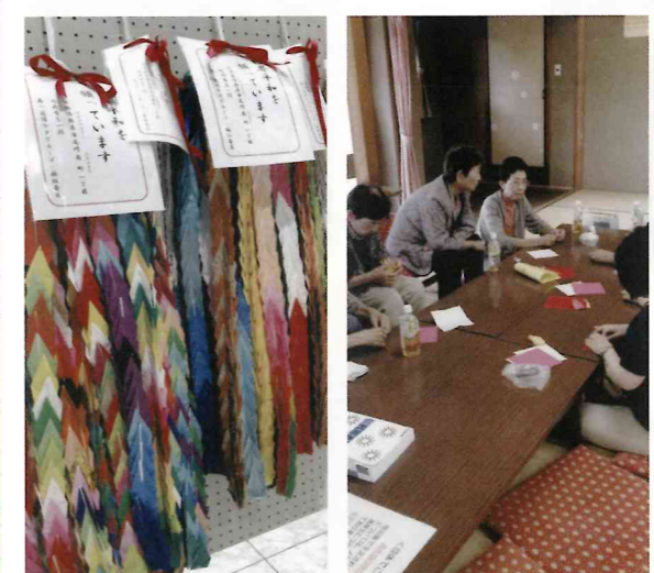
予防救急の学習と平和の折り鶴作り