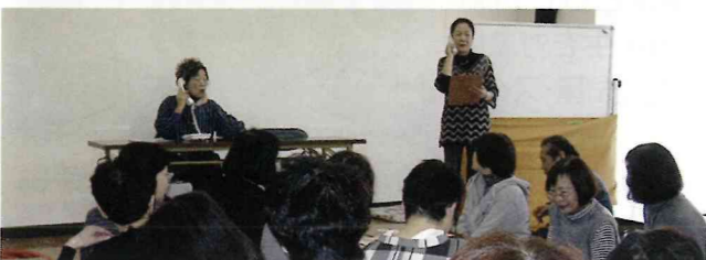
ヨガ、寸劇(悪徳商法)、オカリナ演奏、昼食会、ビンゴゲーム