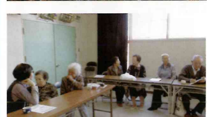
民生委員のお話とマジック