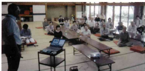
震災に対する備えの研修、昼食会 カラオケ