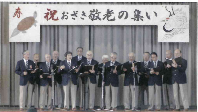
岐阜ボーカルサウンドシンガーズ

◎尾崎地区社協では、各行事について写真やビデオ撮影を行い、その様子を尾崎地区社協広報やネットに載せさせていただきますので、ご了承ください。フェイスブックの尾崎社協のページは、登録しなくてもホームページと同様にパソコンやスマホから誰でも見ることが出来ます。