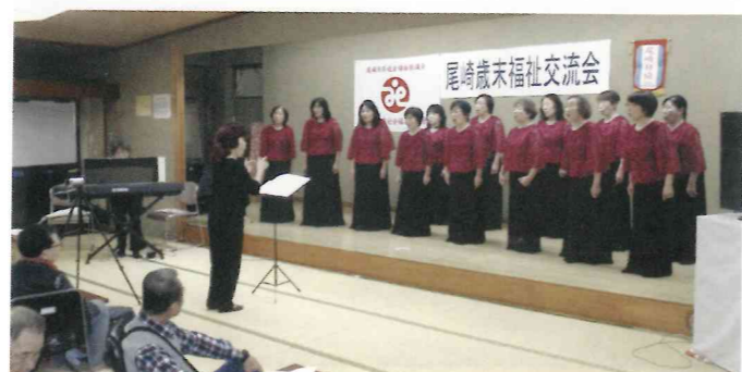
コーラスはあじさいの皆さん