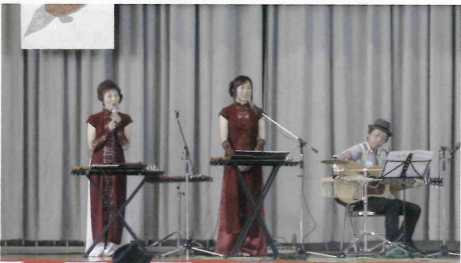
ヴィオラとギターの演奏