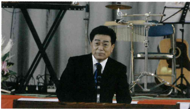
西森会長のあいさつ