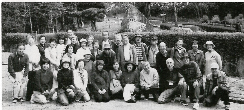
▲鶴沼の森にてお花見会

この社協のG-NETで、沢山の友人が出来、毎回楽しい話が弾んで居ます。また、恒例の「そば打ち会」や「敬老の集い」等にも参加させて頂き友人の輪は一段と広がり、とかく暗く成りがちな毎日が救われている現状です。