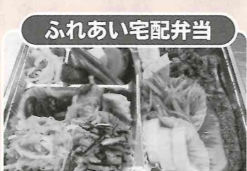
ふれあい宅配弁当