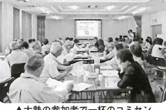
▲大勢の参加者で一杯のコミセン

めにも、地域のためにも認知症について正しく知って、認知症の人たちの応援者になりませんか。」と呼びかけたところ前回はるかに上回る80名の方々が参加され、関心の深さがうかがわれました。 講師は包括支援センター「ジョイフル各務原」で、認知症をビデオや講話や寸劇などで、サポーターとしてできることなどを学びました。