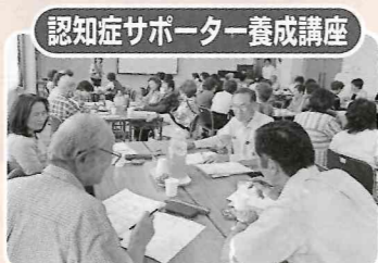
認知症サポーター養成講座