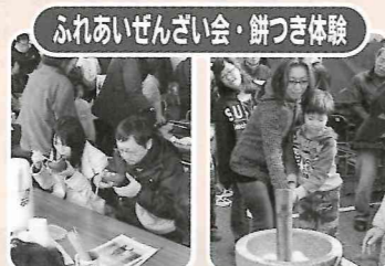
ふれあいぜんざい会・餅つき体験