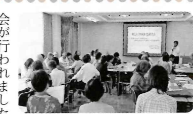
▲活発な意見交換がありました

5/31 認知症サポーター養成講座 前年度に引き続き第二回目の「認知症サポーター養成講座」がコミセンにて開催されました。 「認知症サポーターとは、認知症の人や家族を温かく見守る応援者です。自分のためにも、家族のために行われました。