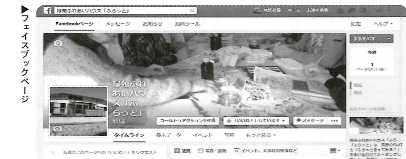
▶フェイスブックページ

フェイスブック開設 ふらっと専用のフェイスブックページをオープンしました。 今年の4月25日、ふらっと専用のフェイスブックページを開設しました。ふらっとでの楽しいイベントの様子や今後の予定などを公開して皆様に配信していく予定です。ふらっとをご利用される方々の情報共有の場所にしていきたく考えています。 なお、フェイスブックの会員にならなくても情報をみることはできます。インターネットの検索サイトから「緑苑ふれあいハウスふらっと」で検索してください。