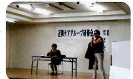
▲悪役になりきって

「ふらっと」まで足腰が弱く来られない方のため、またご近所同士のふれあいの場を設けるため、集会所等に出向いてイベント等を行う「出前「ふらっと」」が開始されました。