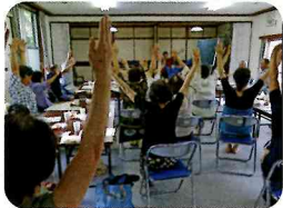
▲まずは健康体操で