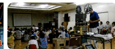
▲子ども達で一杯のコミセンホール