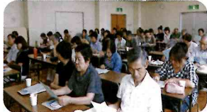
▲真剣に聞き入る参加者

超高齢化社会のいま、日常起こる事件や事故などに、お年寄りが関わるケースが増えています。