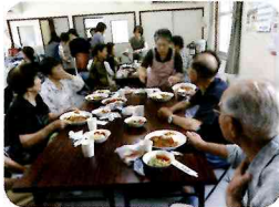
▲おいしいカレーで話も弾みました