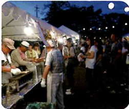
▲おいしい団子はいかが？