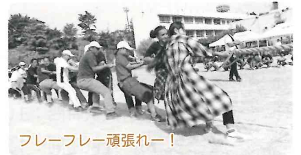
フレーフレー頑張れー!

会場には大勢の緑苑市民が詰めかけて、可愛いお子さんの競技や年を忘れて頑張るお年寄りの活躍ぶりなどに終日大声援がとびました。