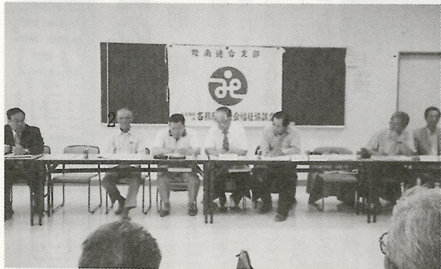
第一回支部総会 6月4日

は、「助け合いの心をもつ」 一方、陵南支部社協は、「助け合いの心をもつ」 市社協では今年度から「ふれあい・いきいきサロン」の活動推進に力を入れて小規模のボランティアグループ活動に期待をしております。