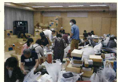
陵南ふれあい運動会バザー準備