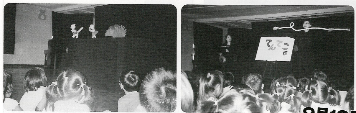
人形劇大変おもしろかったね