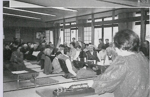
独り暮らしの方と70歳以上のご夫婦のみの方々と の交流。ボランティアの大正琴よかったね。(稲田園)