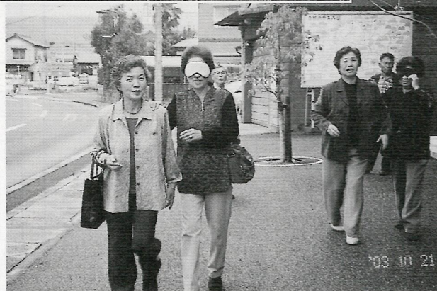
近隣ケアのみなさん 障害者やお年寄りの疑似体験 いかがでしたか