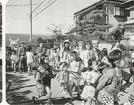
ピカチューも一緒に、祭りだ、祭りだ！ワッショイ、ワッショイ 10/10・11 丸子町