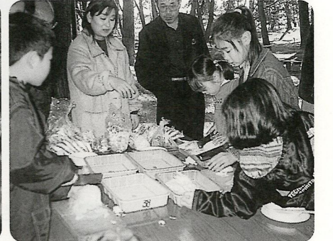
バーベキューだよ！天気よし、味よし、笑顔よし、みんな食べ放題！ 12/13 古市場町