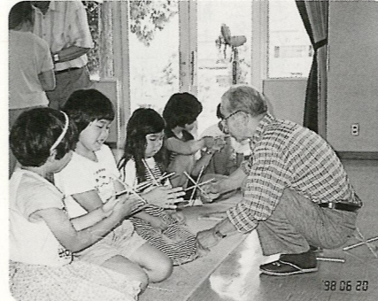
飛んだ飛んだ割りばしバツタ。ぼくわたしの自信作！ 6/20 羽場町