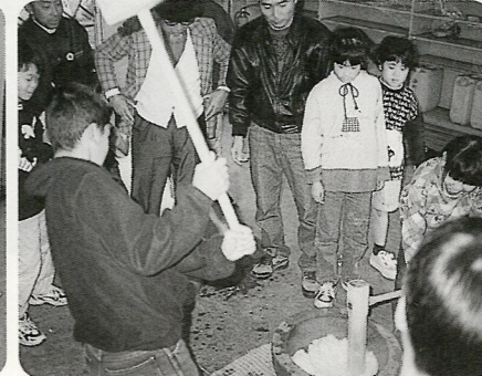
早く食べたいよー。楽しいもちつき大会 12/12 西町