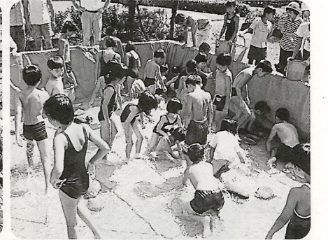
“ファーイ”うまくなりますがつかまってくるかな！ 8/6 小伊木町