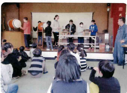
小伊木町：クリスマス会