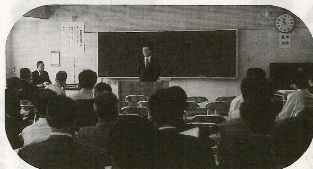
平成9年度支部総会の開催 5月18日鵜沼福祉センター

支部の四分の三以上が専属の支部長を置き、ユニークな活動を行っています。鵜沼第一連合支部においても、福祉に熱意のある方が、多数おられますので、年度から専属の支部長を置くと思っております。