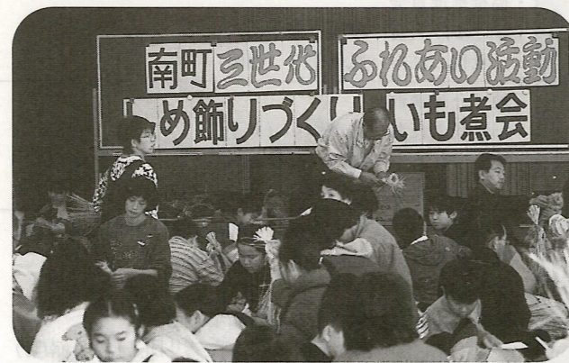
11/23 形の整った美しいしめ縄が沢山出来上がりました。