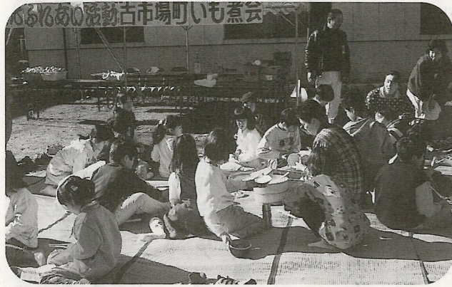
12/14 全員が心も体もしんから温かくなった素晴らしいも煮会。来年も食べたいなー