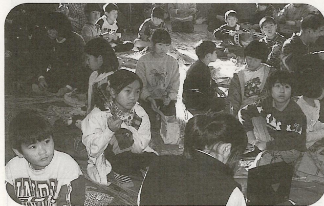
12/13 3時間以上の制作で、粒よりの作品ができました。(縄作り)