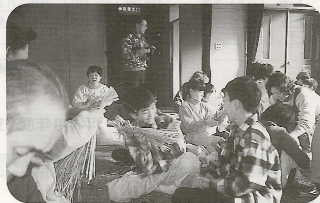
地域のお年寄りの方々と今年も一日楽しくしめ縄作りをしました。