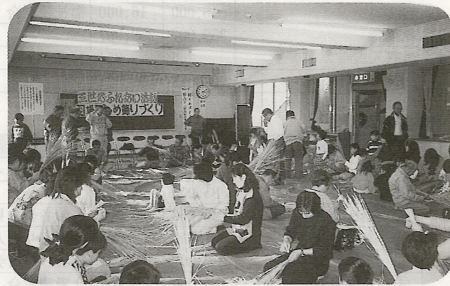
11/15 子供・大人・老人全員協力して、傑作が多くできました。