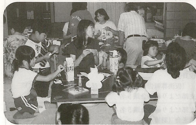
7/19 みんな夢中になって制作しました。(風車作り)