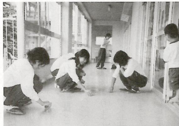
幼稚園の廊下を清掃 (中央中生徒) じーっと園児は見ている

ここに住民の皆さんと行政と施設などの共働、医療・福祉保健の連携による在宅福祉活動が重視され一方、子育て支援、幼子から15才までの健全育成、などが一段と大切な社会情勢があります。そこで自治会、民生協、近隣ケア、ボランティアなど中広く結集した住民が主役の福祉のまちづくりは社協加入が前提条件です。