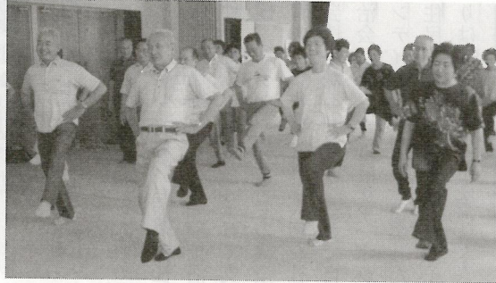
介護予防教室 7月11日 (各務原区コミュニティセンター)

さて、この八月は社協会員の継続並びに、新規加入の募集本番の月間です。特に一軒一軒訪問される班長さんと、まとめられる自治会長さんには大変お世話になります。勿論社協役員も総力で全世界帯加入の活動を展開しますので、皆様のご協力をお願いします。