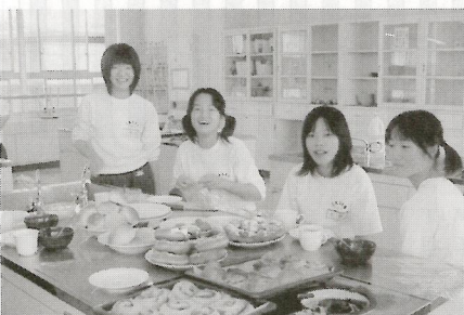
(中央中) マナビストパンづくり講座

鵜二と中央は比較的若い。2010年には各務原市20.3%全国22.0%の高齢化率が予測されています。