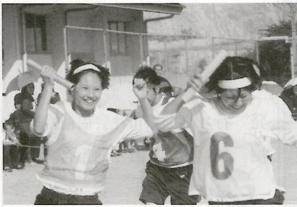
「ウォー」やったねー (中央中体育祭)

社協は、全国規模で「地域在宅福祉を担う」ための民間の公共性を持つ組織です。少子高齢社会は、一女性の出生率が1.32、また世界一の長寿国で、一人暮らしのお年寄り、高齢夫婦だけの世帯、そして共働き、核家族など多面的な生活様式があります。今までは要介護状態になると行政が措置してきました。現在は、四年前から、四〇才以上の人が介護保険料を拠出し、介護の度合いに応じて、要支援と介護度1〜5でケアされます。一方各務原市でも例えば特養は4か所ありますが、それでも現在330人が待機中です。