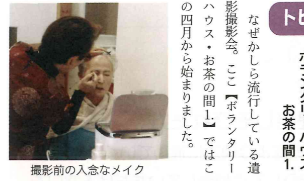
撮影前の入念なメイク

地区社協総会当日参加され た皆さんに、熊本地震への義 援金を募りましたところ 八、六八七円の募金が集ま りました。 この募金は各務原市社会福 祉協議会を通じて、(福) 熊本市共同募金会へ寄付しま した。