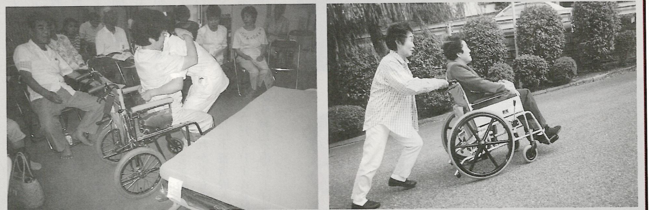
介護の苦勞を体験(移乗の方法を学ぶ)