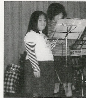
子どもたちもカラオケに参加