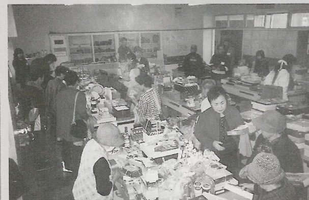
買いにみえるお客様