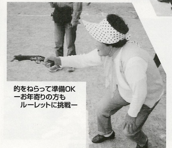
的をねらって準備OK 一お年寄りの方も ルーレットに挑戦一