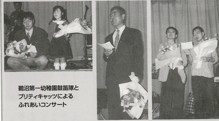
鶴沼第一幼稚園鼓笛隊とプリティキャッツによるふれあいコンサート