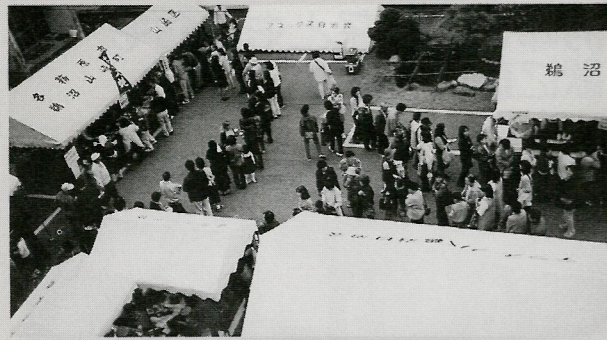
鶴三小学校屋上より撮影