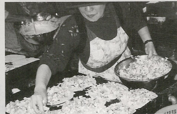
各自治会による模擬店の様子