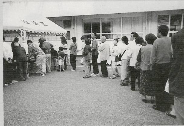
バザー広場に大行列!