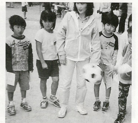
何ポイントとれるかな 一サッカーゲームに興味深々一