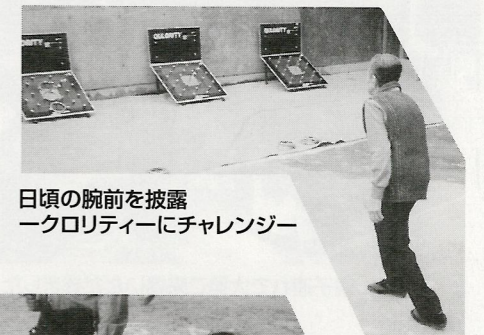
日頃の腕前を披露 一クロリティーにチャレンジ