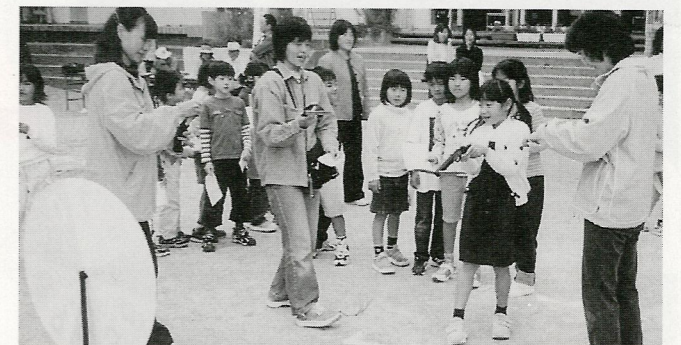
「お母さん頑張って!」一親子でルーレットにチャレンジ