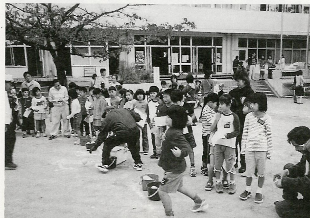
「早くやりたいよ〜」一ボール投げは大人気一