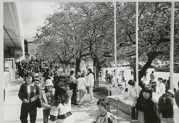
親子連れで大勢ご来場いただきました