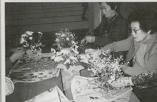
お年寄りの皆様にも参加していただいた生け花体験