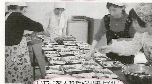
いちごを入れたら出来上がり