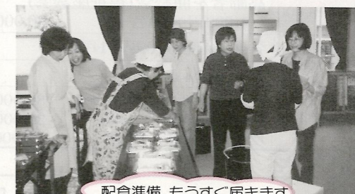
配食準備、もうすぐ届きます