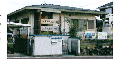
住宅地の一角にある「ささえあいの家」=岐阜県各務原市つつじが丘で