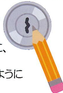
鉛筆の芯の効果 .....あるお宅で聞いた話 玄関の鍵が抜きにくい。 ケアマネージャーが、鍵の差込口に、 鉛筆の芯をいれた。 スムーズに鍵を抜くことができるよう になりました。