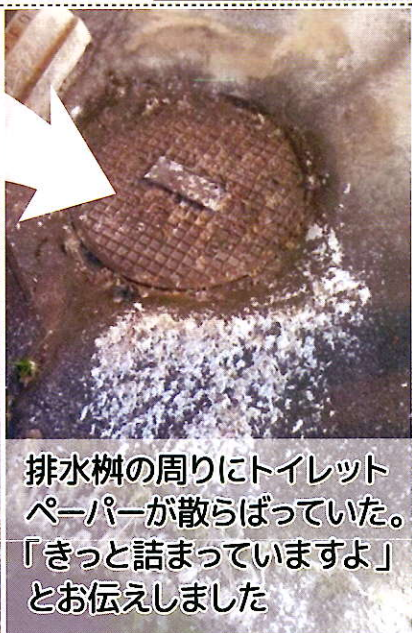
排水桝の周りにトイレト ーパーが散らばっていた。 「きっと詰まっていますよ」 とお伝えしました

詰まっていたのは、こんなに大きな木の根っこ！ 土管の太さまで、根が成長しています。