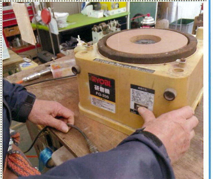
研磨機 長く使って不具合がでたとのこと。 研磨機が壊れるまで様々な作業をされたの です