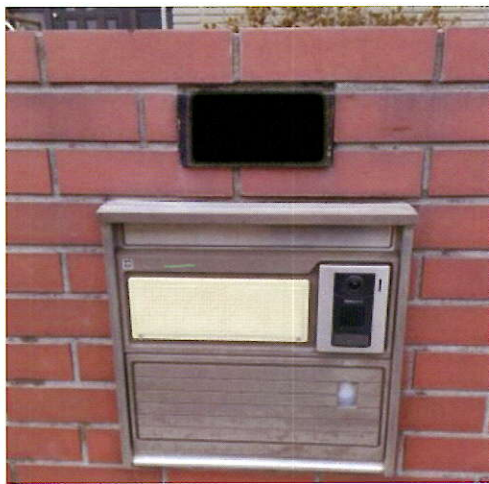
表札の撤去 施設入所のため、空き家に。 表札をとり除きました。さみしいです。

★困りごとができたなら ☎058-377-3400 ★どんなことでも、まずはお知らせください。業者の紹介もします