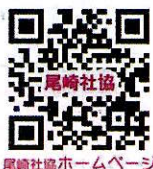
尾崎社協ホームページ

所属 長=自治会長、福=福祉委員、民生=民生委員児童委員、主児=主任児童委員、青少年=青少年育成市民会議、緑風=シニアクラブ尾崎第一緑風会、友の会=シニアクラブ尾崎友の会、長生会=北洞長生会、補導=少年補導委員会、体振=体育振興会、推薦=規約第6条による推薦者(ボランティア)