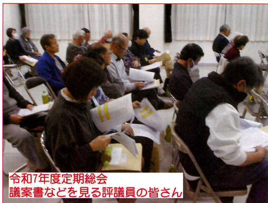
令和7年度定期総会 議案書などを見る評議員の皆さん

総会の出席は、評議員71名のうち51名(委任状21名を含む)でした。他に市社協事務局から2名と、オブザーバーとして8年度の役員(予定者)として8年度の自治会長さんなどにもご出席をいただきました。