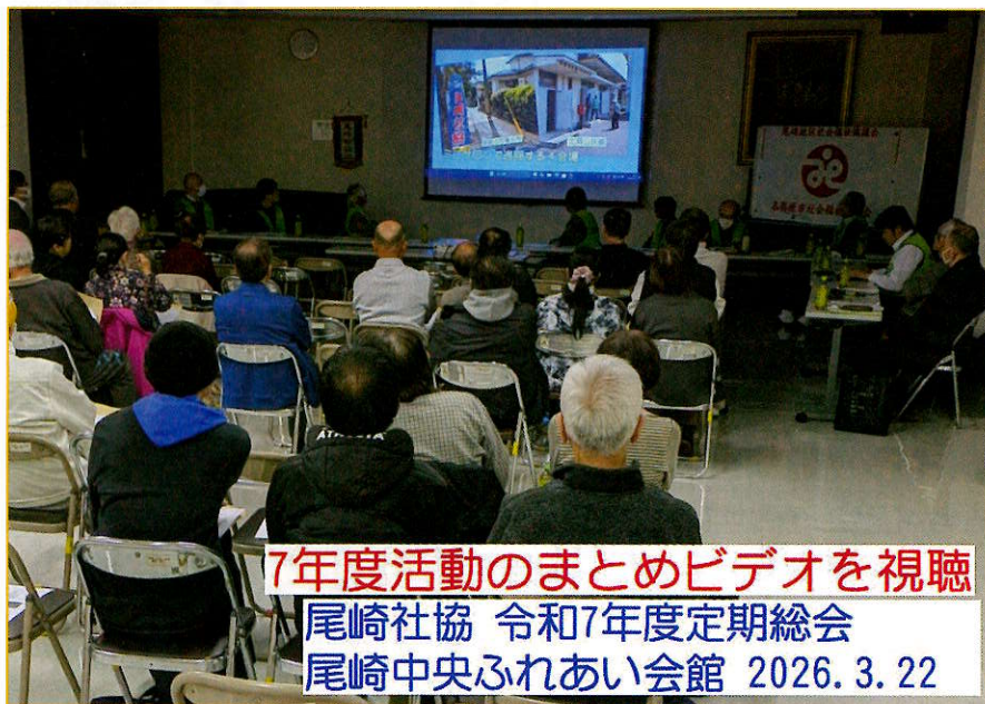
7年度活動のまとめビデオを視聴 尾崎社協 令和7年度定期総会 尾崎中央ふれあい会館 2026.3.22

議案に対しては、8年度予算執行について建設的な提案をいただきました。結局、7年度事業報告および決算報告、8年度事業計画案および予算案、8年度役員案、規約改正案について、常任理事会の原案のすべてを承認いただきました。