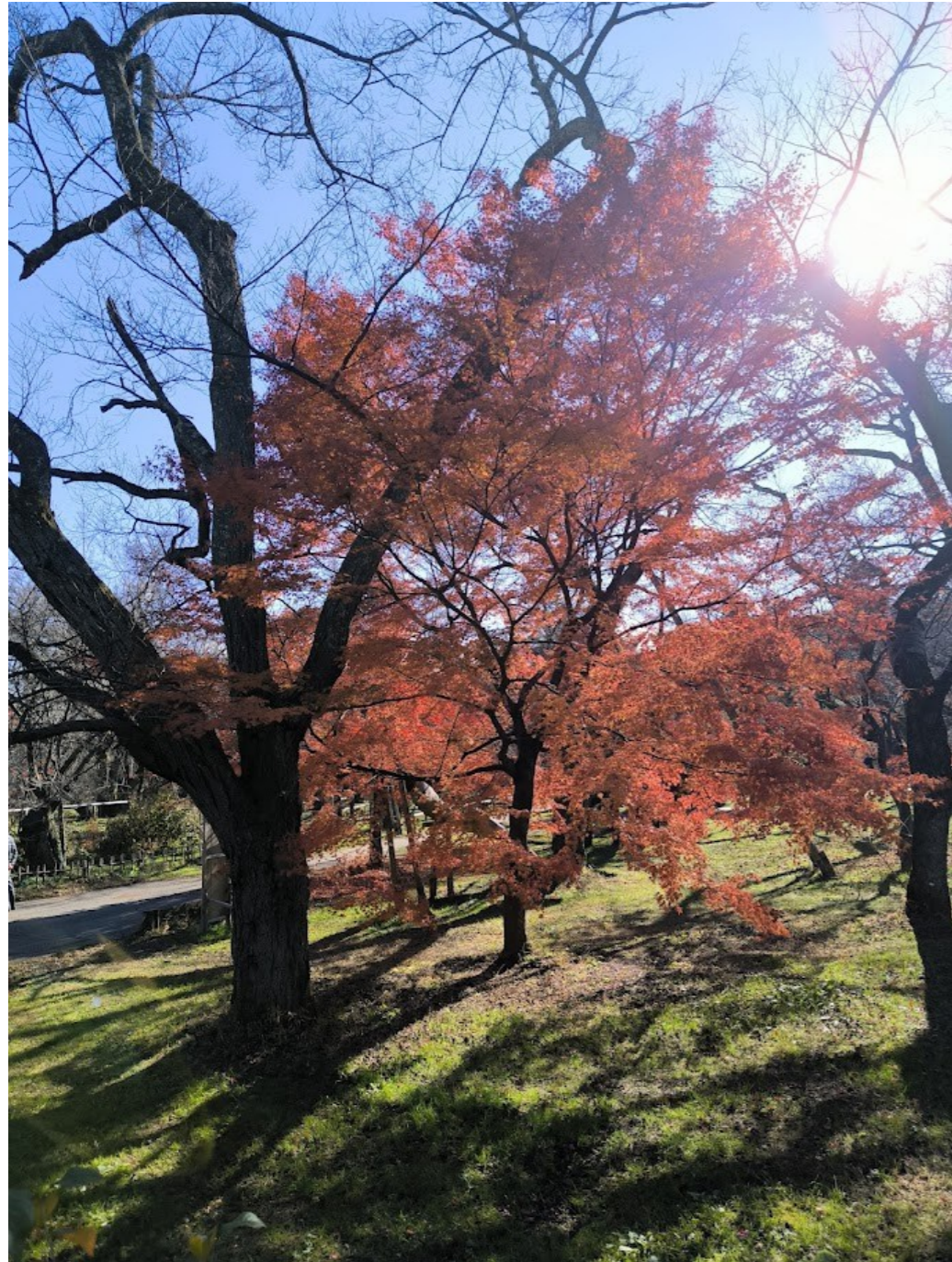
「高遠城址公園の紅葉」(長野県伊那市)